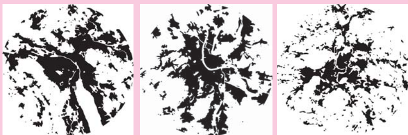
Abb. 2: Siedlungsflächen (schwarz) der drei Agglomerationen Zürich (links), Basel (Mitte) und Bern (rechts) innerhalb einer Kreisfläche mit 6 km Radius (alle für das Jahr 2000) (Jaeger & Bertiller, in Vorbereitung).