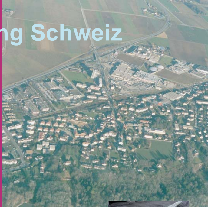
Abb. 1: Zersiedelte und ausgeräumte Landschaft im Schweizer Mittelland. Die Zersiedelung geht einher mit Bodenversiegelung und der Verkleinerung von Lebensräumen von Pflanzen und Tieren.

Das Projekt ermittelt die Entwicklung der Landschaftszersiedelung in der Schweiz von 1940 bis 2002 und zeigt Trends für die künftige Entwicklung auf, indem es verschiedene Szenarien entwickelt. Auf dieser Grundlage zieht das Projekt Rückschlüsse für die Raumplanung und macht konkrete Vorschläge für die Steuerung der künftigen Siedlungsentwicklung gemäss den Grundsätzen der Nachhaltigkeit.